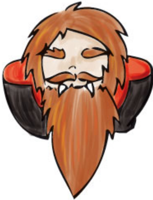
Gørbluck se déguise en vampire.