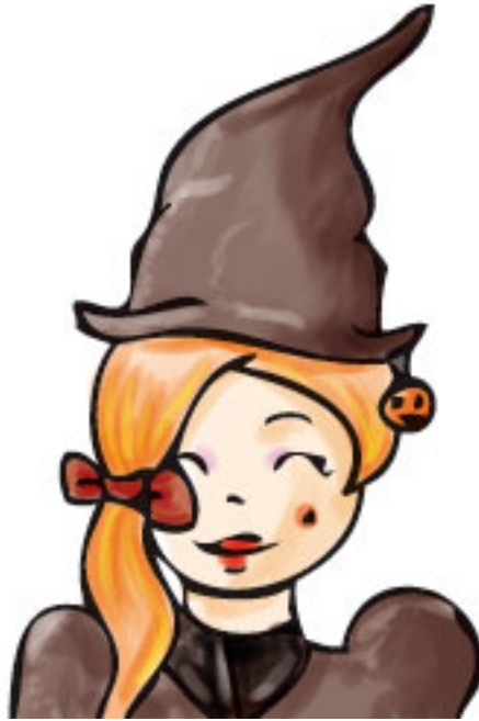
Mjølnerk se déguise en sorcière.