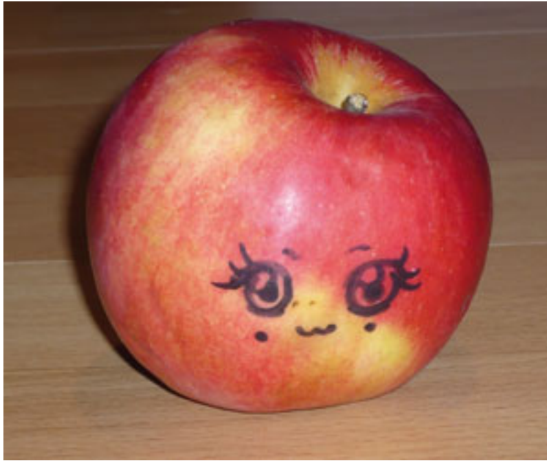
Voici Mademoiselle Pomme.