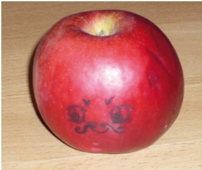
Et voilà Monsieur Pomme.